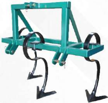
ชุดคราดสปริง 3 ขา