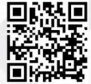
VDO การทำงาน 4 ขา SST150/4