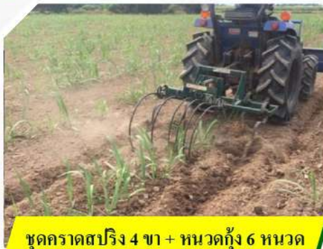
ชุดคราดสปริง 4 ขา + หนวดกึ่ง 6 หนวด