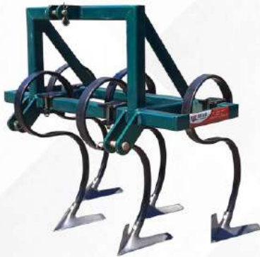
ชุดคราดสปริง 5 ขา