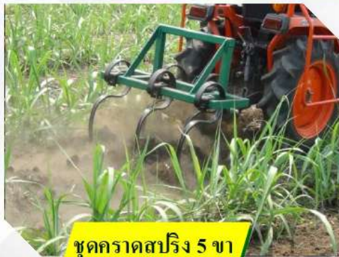
ชุดคราดสปริง 5 ขา