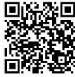
VDO การทำงาน SST99/3