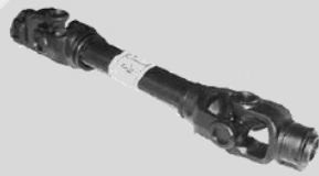
ขอยนำเข้าจาก อิตาลี